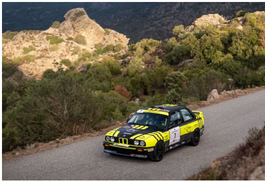
Christophe Vaison/Pascal Duffour (BMW M3).