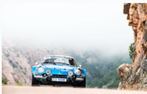
Nombreuses seront les Alpine lors de cette édition qui célèbrera la marque.

« Nous avons voulu faire plaisir à un maximum d'équipages et avons décidé d'accepter davantage d'engagés que lors des éditions précédentes. Face à ce nombre record d'inscriptions, cette 21ème édition prend une toute autre dimension. Aussi avons-nous déployé tous les moyens nécessaires et renforcé nos équipes à tous les niveaux : encadrement, sécurité... Je ne cesse de dire à nos équipes qu'elles ne devront pas être seulement bonnes, mais qu'elles devront se montrer excellentes et irréprochables. Nous allons également être extrêmement rigoureux sur le plan sportif et sensibiliser l'ensemble des concurrents afin que le rallye ne prenne aucun retard et se déroule dans les meilleures conditions pour tous. Le temps de pilotage restera inchangé. Dans les villes étapes, nous aurons cette année deux parcs fermés, au lieu d'un seul auparavant. Nous avons également prévu davantage de zones d'assistance. C'est une configuration complètement différente, sans précédent. Le rallye va « investir » les villes que je remercie d'avoir accepté volontiers de s'adapter à la situation ».