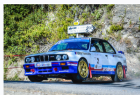
Parmi les BMW M3 engagées, celle de Christophe Casanova, 2e en 2020, sera à surveiller.