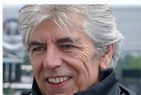
Vainqueur du Tour de Corse 1987, Bernard Béguin sera ouvreur de la 21e édition.