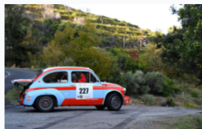
A l'image de cette Fiat Abarth, les italiennes trouvent en Corse un merveilleux terrain de jeu.