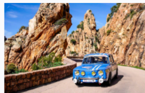
Renault 8 Gordini dans le décor idyllique des routes corses.