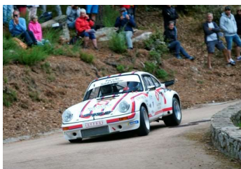
Vainqueur en 2020, le couple Oreille entend défendre chèrement son titre.

Un parc de regroupement est prévu à Aleria à partir de 10h30, puis une arrivée à la ville étape de Borgo (une première dans l'histoire du rallye) à partir de 14h27 sur le podium et 17h47 dans le parc fermé du complexe sportif pour les premiers équipages.