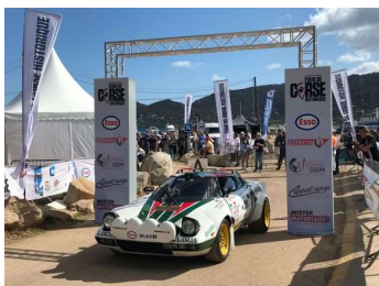
Parmi les premières à prendre le départ, cette Lancia Stratos aux couleurs mythiques Alitalia.

quarante secondes de retard sur le meilleur à l'arrivée. Le rallye est encore long. La Mazda RX7 marche parfaitement, je reste très confiant pour la suite de la semaine ».