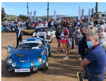
Le public a pu de nouveau accéder en nombre dans le parc fermé et échanger avec les équipages.